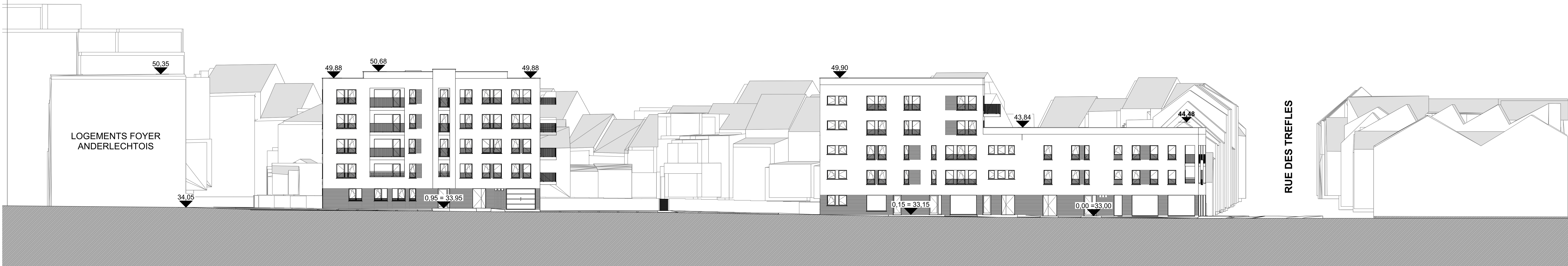
COUPE GENERALE DE PROFIL VOIRIE "PRIVEE" COMMUNALE G2 - 1/20